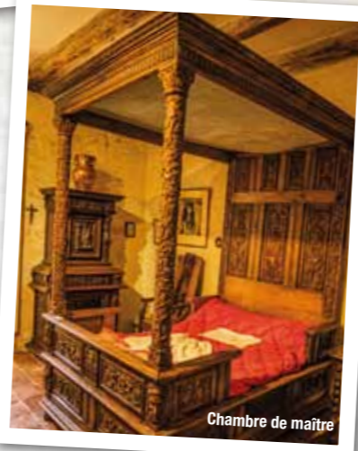
Chambre de maître

Lors des troubles de la guerre de 100 ans, le donjon fut partiellement détruit par un incendie.