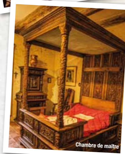
Chambre de maître